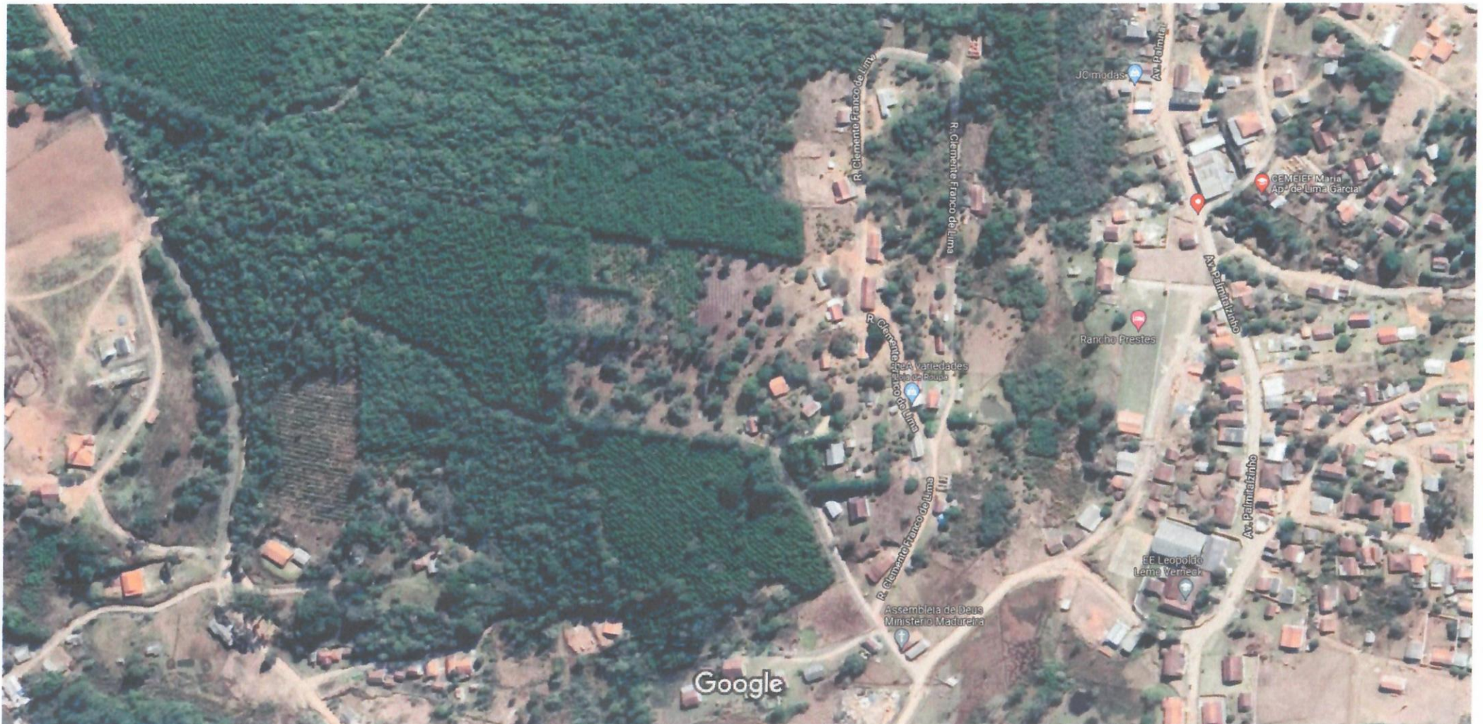
Imagens ©2021 Maxar Technologies, Imagens ©2021 CNES / Airbus, Maxar Technologies, Dados do mapa ©2021 50 m

7 pontos na altura da Rua Clemente onde a mesma bifurca em "Y", sendo 2 pontos a esquerda e 2 pontos á direita