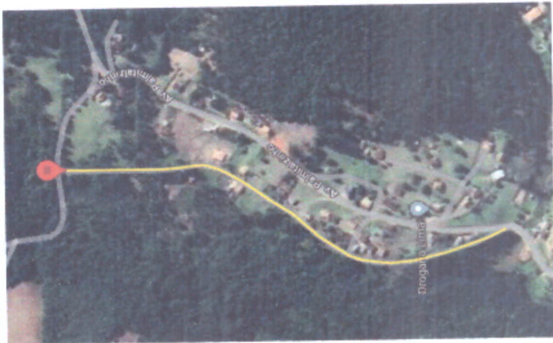
IMAGEM DA ESTRADA NOVA